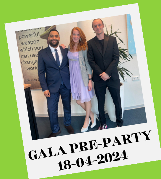
GALA PRE-PARTY 18-04-2024