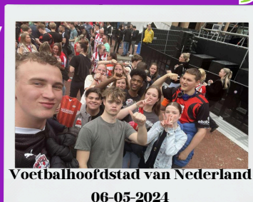
Voetbalhoofdstad van Nederland 06-05-2024

...PSV, voor de 25e keer, kampioen is geworden van de Eredivisie. Veel leerlingen en docenten hebben dit gevierd!